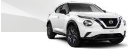
Beyaz (O) - 326