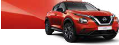
Gün Batımı Kırmızı (M) - NBV