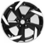
17" Alaşım Jant