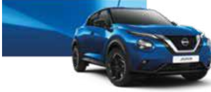
Manyetik Mavi (S) - RCF