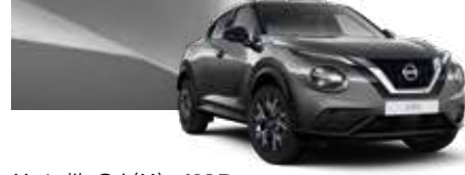
Metalik Gri (M) - KAD