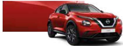
Lav Kırmızı (O) - Z10