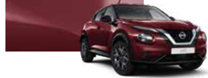
Bordo (M) - NBQ