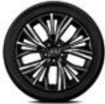
19" Alaşım Jant