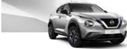
Gümüş (M) - KYO