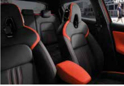
Siyah Deri / Turuncu Kumaş Detaylar*