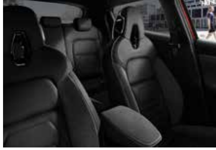
Siyah Deri / Siyah Alcantara*

*Platinum Perso versiyonundan itibaren sunulmaktadır.