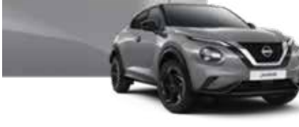
Bulut Gri (S) - KBY