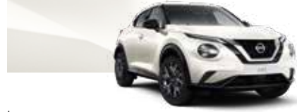
İnci Beyazı (S) - QAB