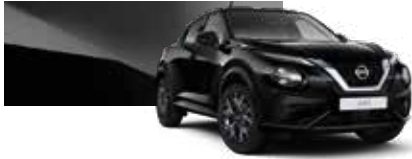
Siyah (M) - Z11